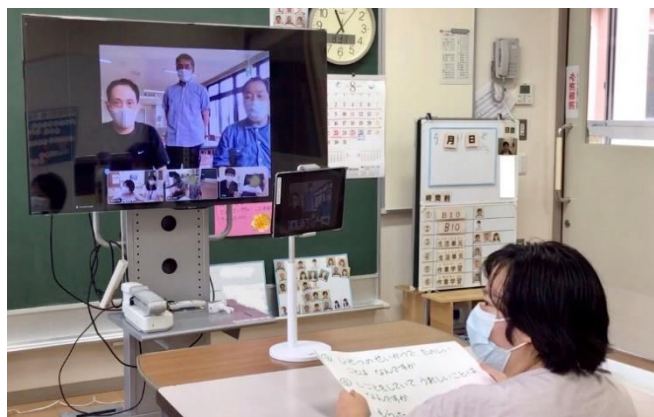
Web会議システムで、各教室と病棟、仙台自立の家をつないでの質疑応答の様子

中学部B組とD組の進路学習として、社会福祉事業所「仙台自立の家」を見学しました。