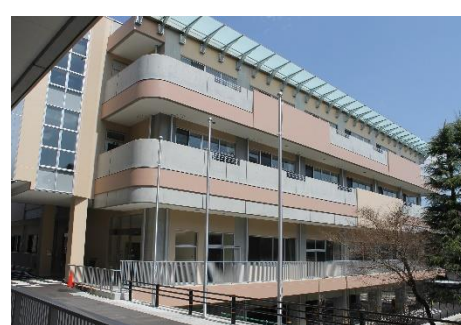
現在の拓桃支援支援学校 校舎