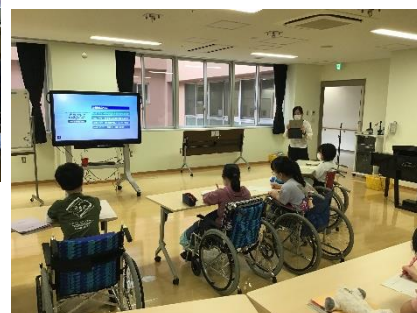
中学部の授業の様子