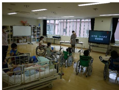
小学部の授業の様子

情報モラル教育の一環として「スマホ・ケータイ安全教室」を学部ごとに行いました。子供たちは、正しい知識を知ること、自分自身を危険から守ることができることを改めて感じていた様子でした。