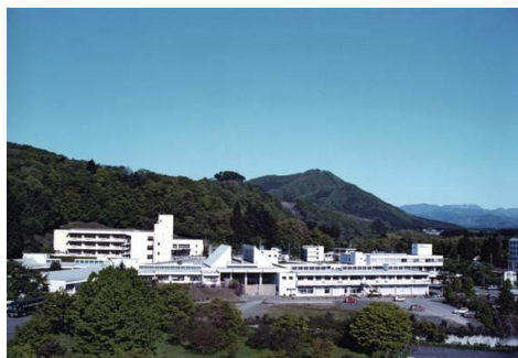
仙台市太白区秋保 拓桃医療療育センターと拓桃支援学校

来年度は、開校50周年を記念した式典の開催を予定しています。これまでの歴史を振り返ると共に、本校における特別支援教育の発信の機会としていきたいと考えています。