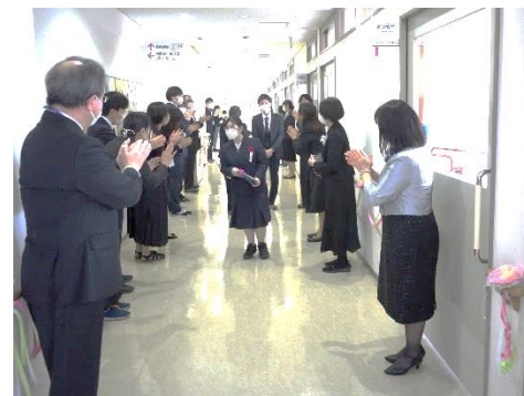
門出を職員に見送られ