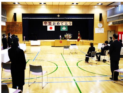
自身の成長と感謝を記した答辞