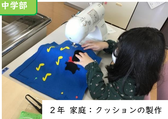
2年 家庭：クッションの製作