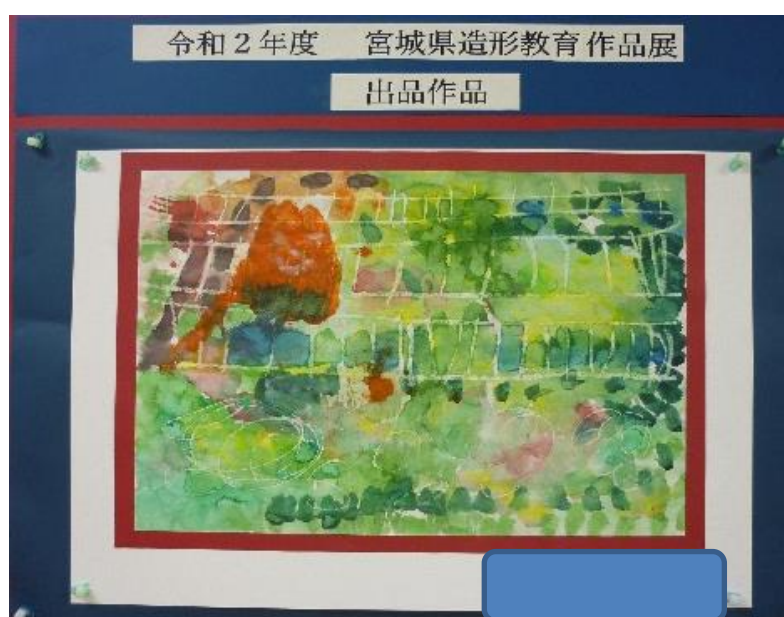
令和2年度 宮城県造形教育作品展 出品作品