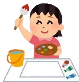
10月：宮城県特別支援学校作品展